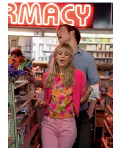
Du 16 au 22 juin VO/VF

Promising young woman est un bonbon acide sur lequel on est heureux de se casser les dents. Bande à part