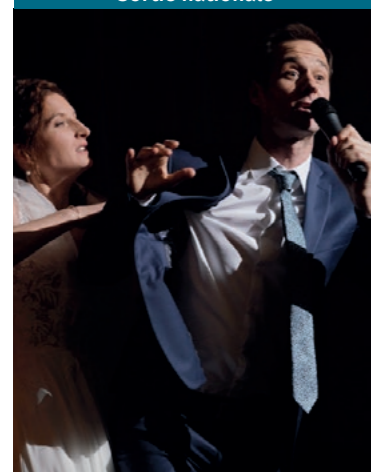
Du 9 au 15 juin Adapté du roman de FabCaro

SÉLECTION OFFICIELLE CANNES 2020 ET L'ALPE D'HUEZ 2021