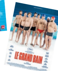
Le grand bain Vendredi 16 juillet