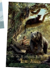
Le livre la jungle Mardi 13 juillet