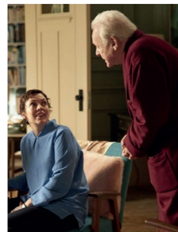
Du 16 au 22 juin VO/VF

OSCAR 2021 : MEILLEURE ADAPTATION, MEILLEUR ACTEUR