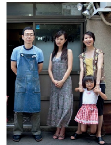
Du 16 au 22 juin VO

Une fable où l'humour cruel repose autant sur les situations que sur la mise en scène. Jouissif. L'Obs