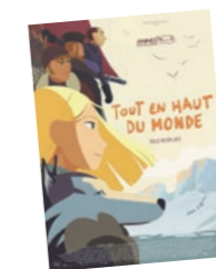
Tout en haut du monde Samedi 3 juillet