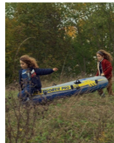
Du 9 au 15 juin

[Céline Sciamma] poursuit son exploration de l'identité féminine. Avec beaucoup de grâce. Télérama