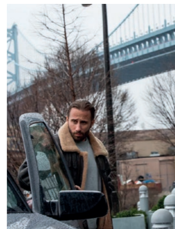
Du 9 au 15 juin VO/VF