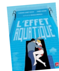
L'effet aquatique Vendredi 2 juillet