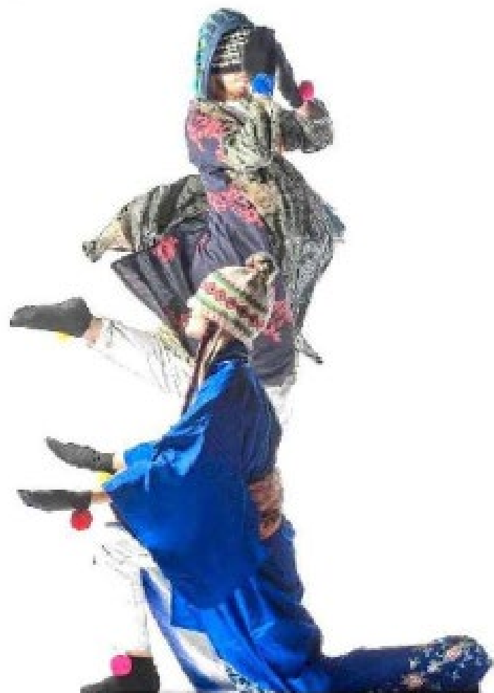
Les petites formes des voyages seront interprétées en duo. La plus grande version sera dansée par quatre interprètes.