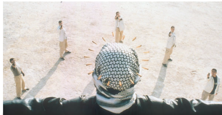
Dimanche 15 mai 18h30

SÉANCE AUX TARIFS HABITUELS | COLLATION OFFERTE | RÉSERVATION FORTEMENT CONSEILLÉE PROGRAMME COMPLET À L'ACCUEIL DU CINÉMA ET SUR LE SITE WWW.SCENESETCINES.FR