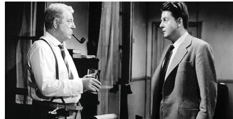
Mardi 10 mai 18h30

SÉANCE AUX TARIFS HABITUELS | COLLATION OFFERTE | RÉSERVATION FORTEMENT CONSEILLÉE PROGRAMME COMPLET À L'ACCUEIL DU CINÉMA ET SUR LE SITE WWW.SCENESETCINES.FR