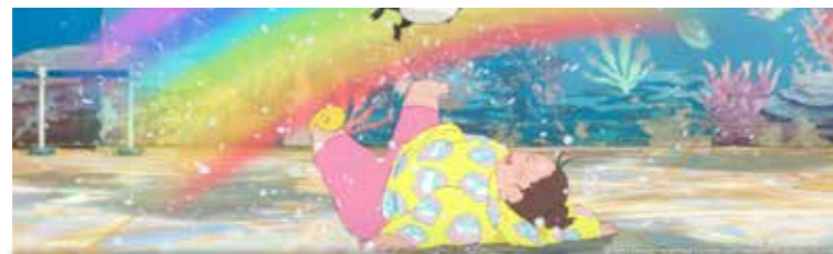
Sam 8 octobre 14h