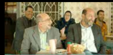
Mer 5 octobre 14h30 et 18h30