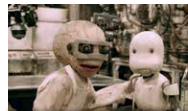
Sam 15 octobre 21h