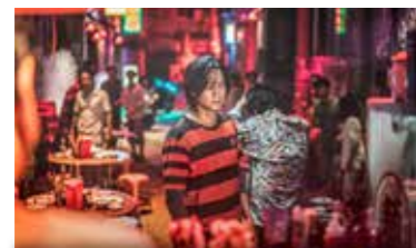
Mar 11 octobre 21h