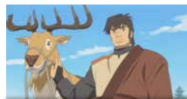
Mer 12 octobre 14h Dim 16 octobre 14h15

Van, ancien guerrier valeureux, est devenu esclave dans une mine de sel. Une nuit, celle-ci est attaquée par des loups porteurs d'une mystérieuse peste. Seuls rescapés du massacre, Van et une fillette, Yuna, parviennent à s'enfuir. Hohnalle, un prodige de la médecine, est mandaté pour les traquer afin de trouver un remède.