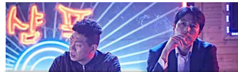
Mar 11 octobre 18h30 Lun 17 octobre 21h