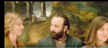
Mer 5 octobre 16h30

DE EMMANUEL MOURET AVEC SANDRINE KIBERLAIN, VINCENT MACAIGNE, GEORGIA SCALLIET FRANCE, 2022, 1H40