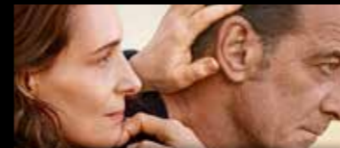
Mer 5 octobre 21h

DE CLAIRE DENIS FRANCE, 2022, 1H56 AVEC JULIETTE BINOCHE, VINCENT LINDON, GRÉGOIRE COLIN