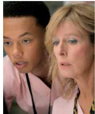
Du 29 mars au 4 avril