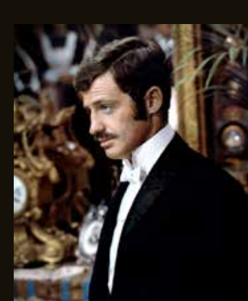
Du 24 au 26 mars