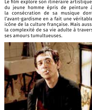
Mercredi 29 mars