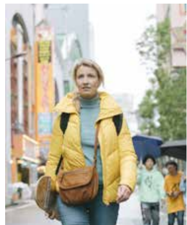
Du 29 mars au 4 avril