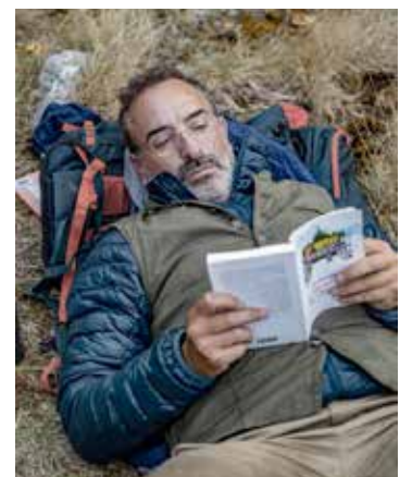
Du 29 mars au 4 avril