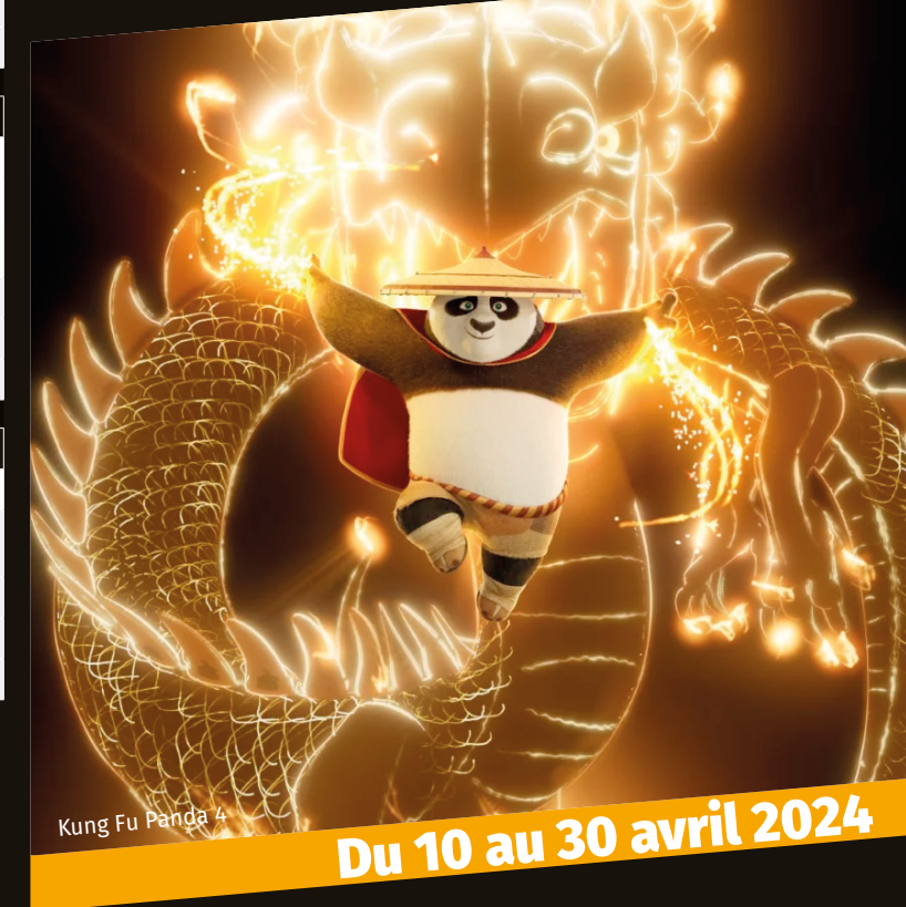
Kung Fu Panda 4