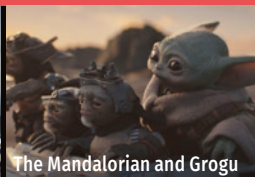
The Mandalorian and Grogu