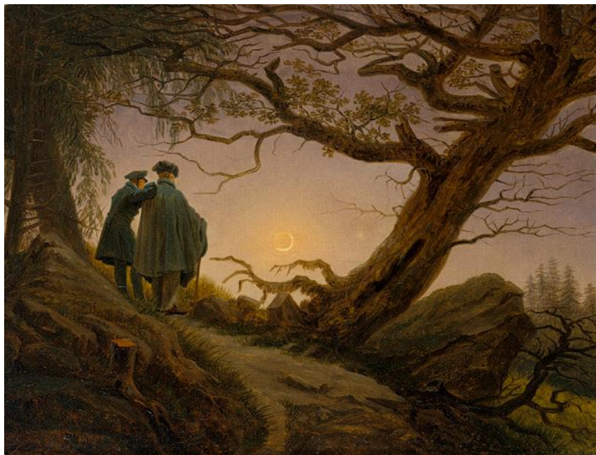
Caspar David Friedrich, deux hommes contemplant la lune

« Route à la campagne, avec arbre. Soir. » dit la première didascalie de la pièce. Beckett racontait que le tableau de Caspar David Friedrich, Deux hommes contemplant la lune avait été la source d'inspiration de Godot . Et effectivement, tout est dans le tableau : la route, l'arbre, les deux compagnons... Et la lune, cette lune qui se lève à la fin de chacun des deux