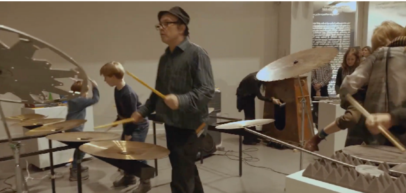
Drum Loop de N.U Unruh