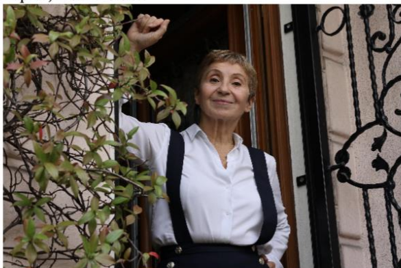
Ariane Ascaride aime se balader des heures dans Paris.