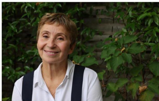
Ariane Ascaride dans sa maison rose de Montreuil (Seine-Saint-Denis).